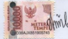
Bella Cristie Graceva Sagala