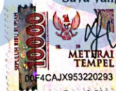
Putri Wanti Sinaga