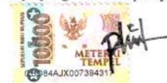
Putri Astrella Sirait