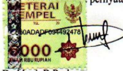
Deddy A.B Purba