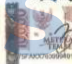
Bunga Aprilia Hidayat