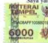
Chindi Fifian Silalahi