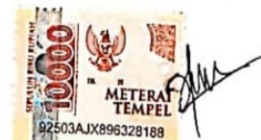
Rouli Novita Sitanggang