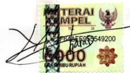
Mutiara Nessia Telaumbanua