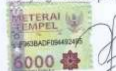
Syafira Ulya Firza

Medan, 19 Februari 2019 Saya yang membuat pernyataan,