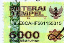
LIDIA SHELI MAWUNTU