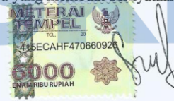
Silvia Dela Vista