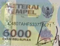
Dizza Pratiwi Nasution